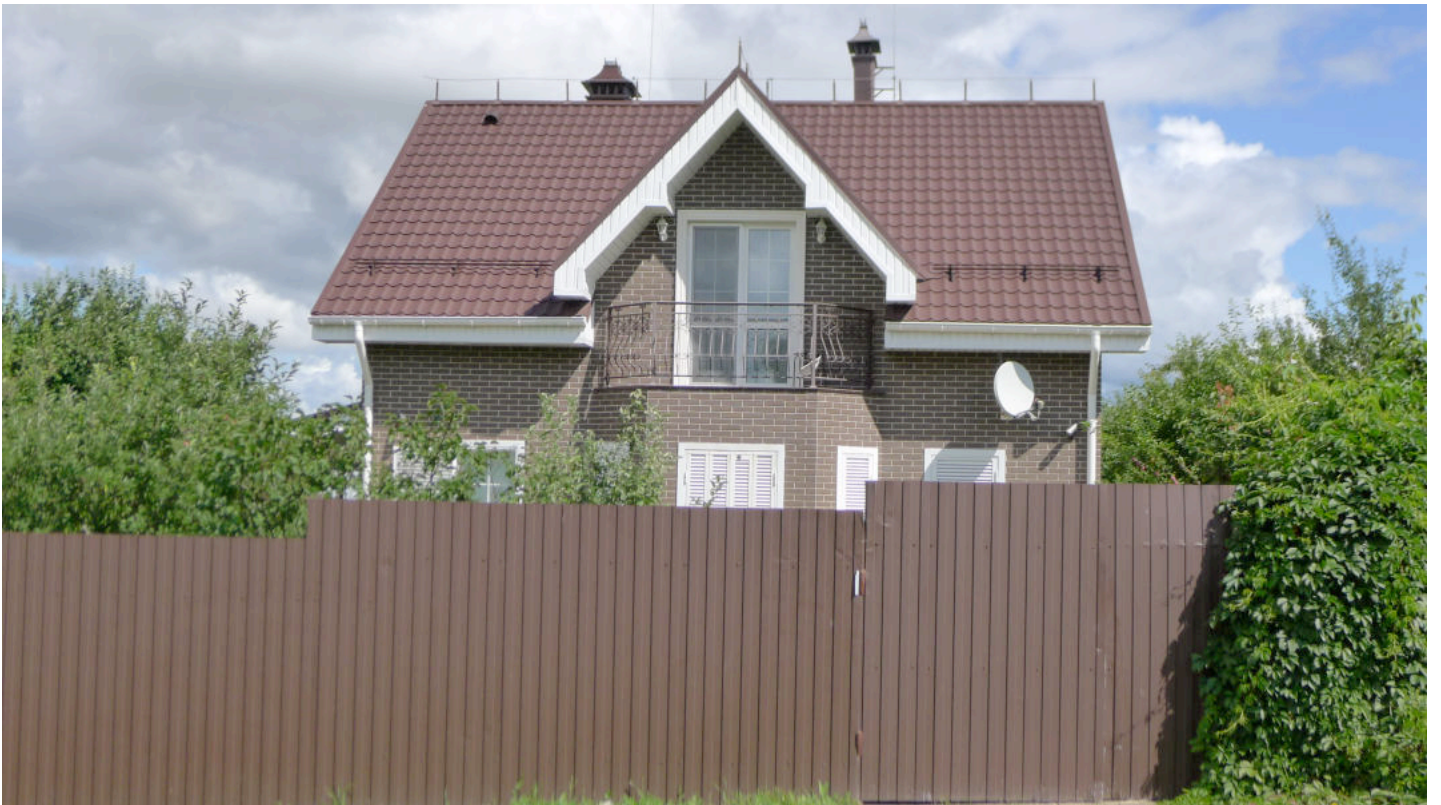
Фото 4. Вид дома с юга.