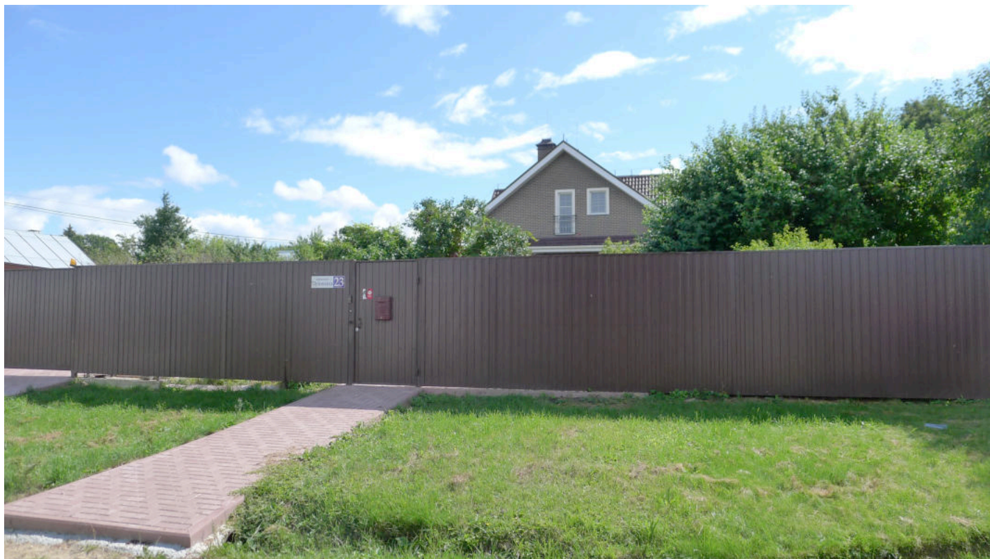
Фото 1. Вид дома (в глубине участка) с запада, с пр. Пушкина.