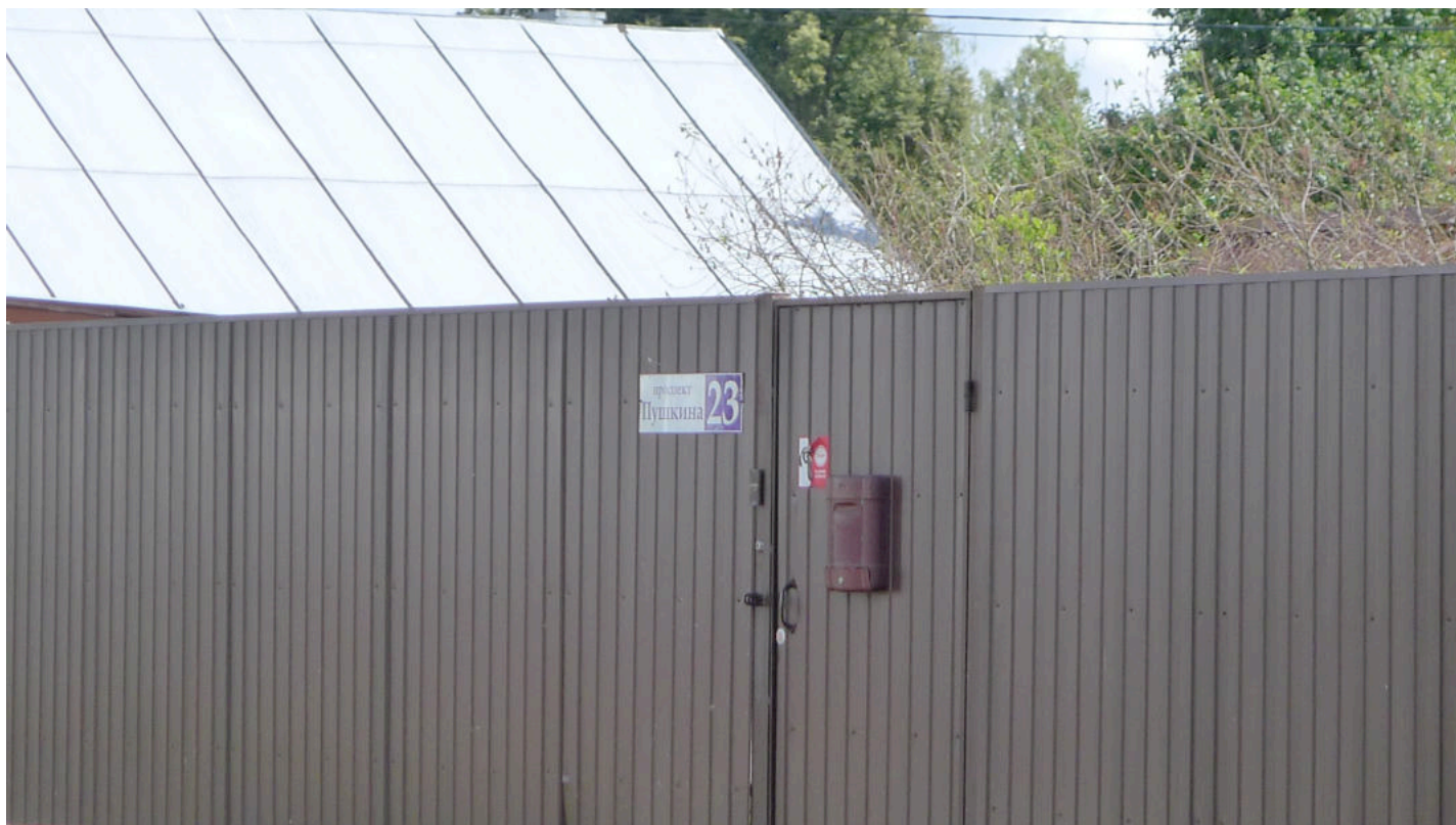
Фото 2. Табличка с адресом на ограде рассматриваемого дома.