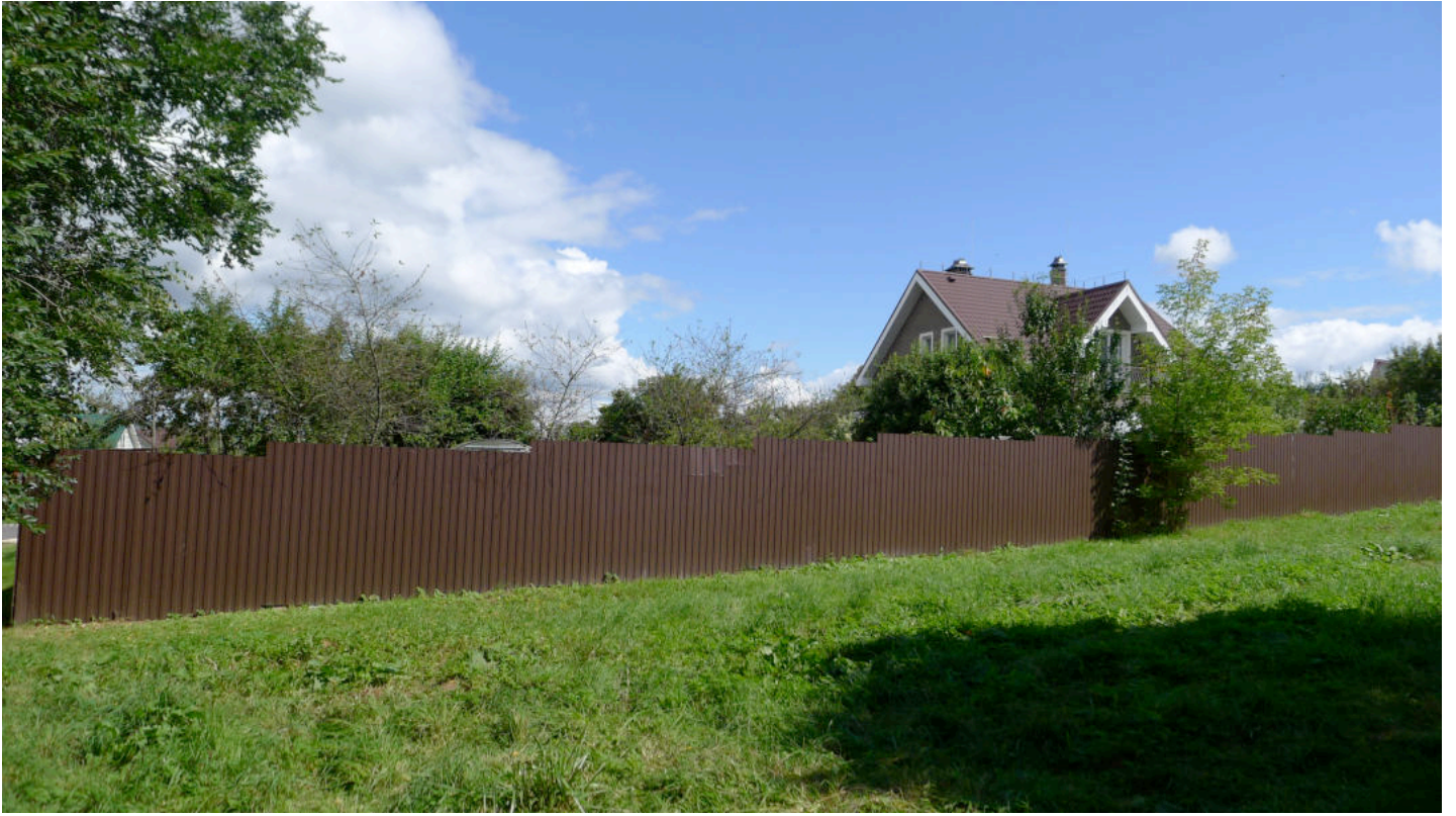
Фото 3. Вид дома с запада.