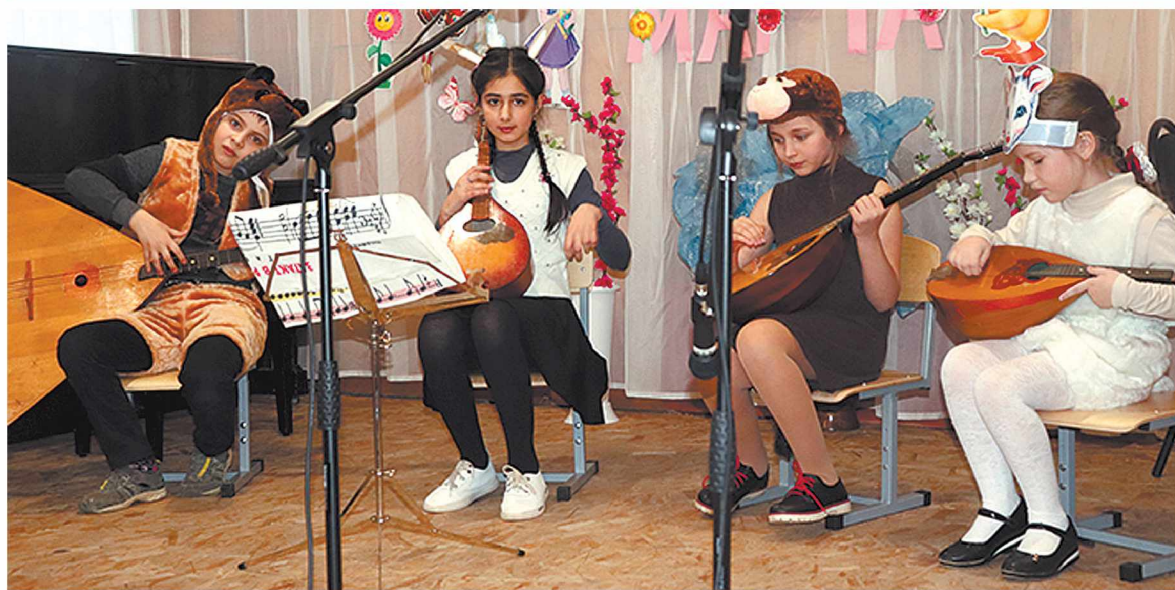
Эпизод к сценке из басни И. Крылова «Квартет».