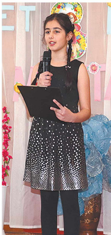
Ведущая Алиса Маргарян.