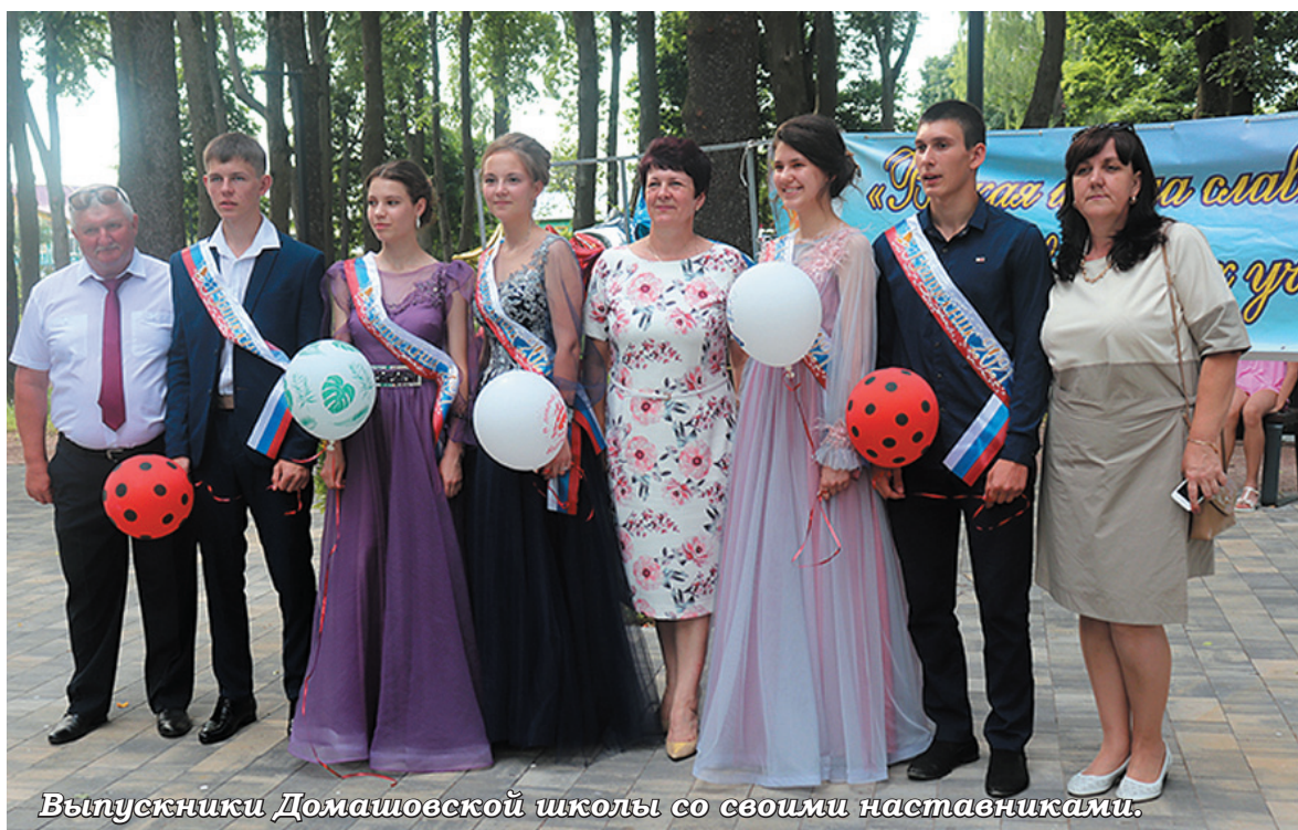
Выпускники Домашовской школы со своими наставниками.

здравления. Но даже в их приподнятом настроении чувствовались нотки грусти.