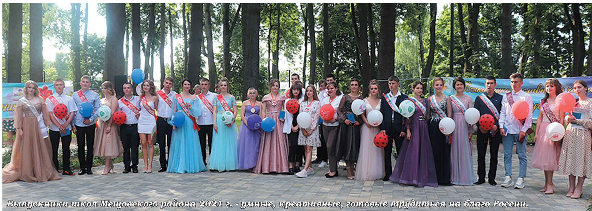
Выпускники школ Мещовского района 2021 г. - умные, креативные, готовые трудиться на благо России.