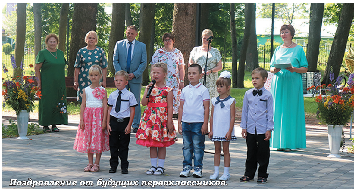
Поздравление от будущих первоклассников.

Каждый год в конце июня в нашем районе, как и по всей России, проходит очень трогательный и красивый праздник - выпускной школьный бал. Молодые люди прощаются с детством и вступают во взрослую самостоятельную жизнь.