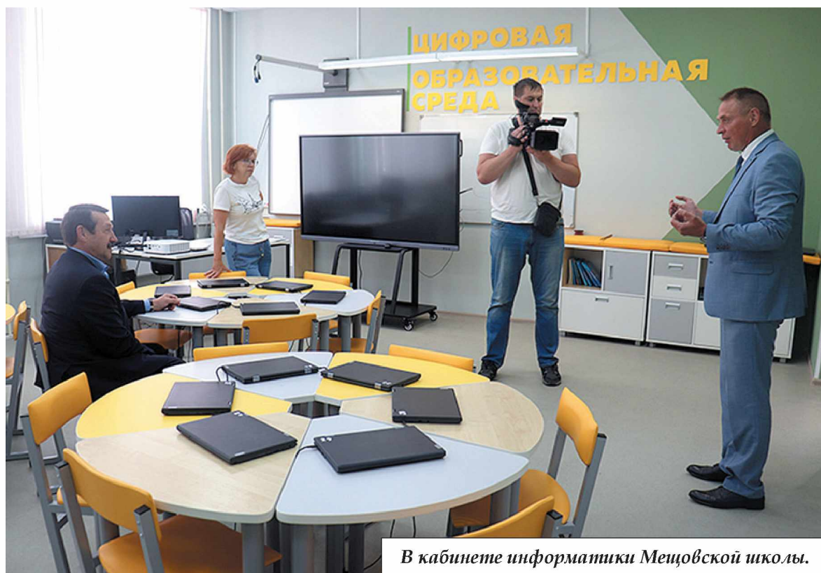
В кабинете информатики Мещовской школы.

Затем Г. И. Скляр побывал на строительстве очень значимого социального объекта в городе — детского сада на 160 мест: поровну для ясельных и дошкольных групп,