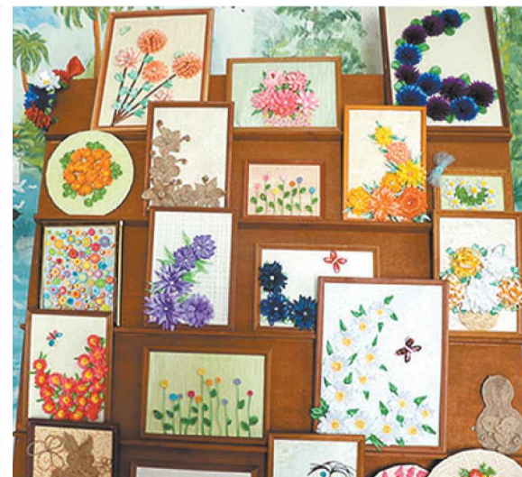
Творчество умельцев студии «Мастерица» (центр «Воспитание»).

ставление «Все дороги ведут в библиотеку».