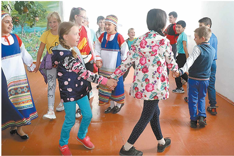
Станция «Центр «Воспитание»: «Шире круг!».