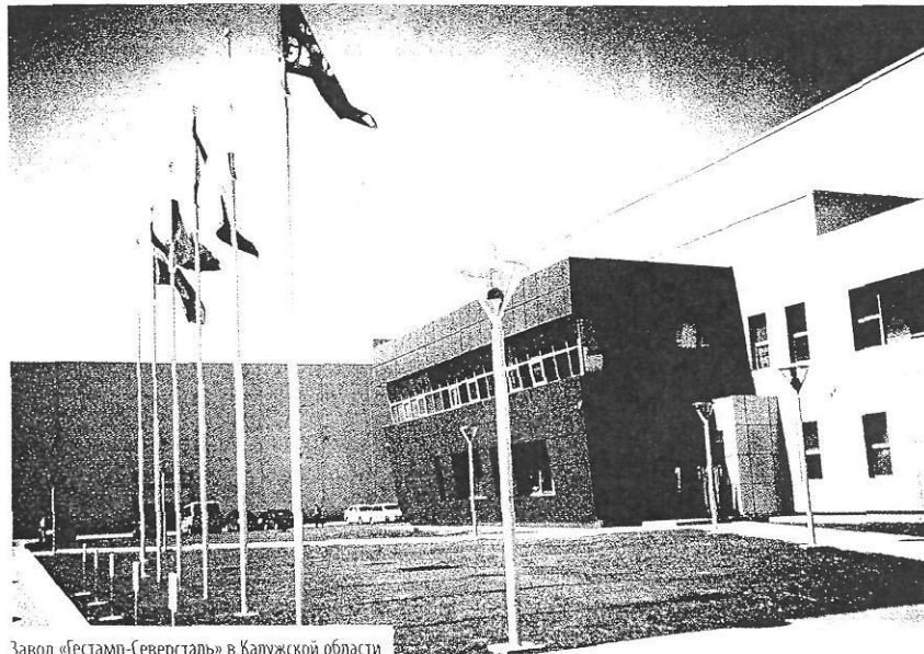
Завод «Бестамп-Северсталь» в Калужской области

— Да, нами были созданы две государственных организации: «Корпорация развития Калужской области», занимающаяся формированием инфраструктуры индустриальных парков и технопарков, и «Агентство регионального развития Калужской области», в задачу которого входит сопровождение инвестиционных проектов. Их деятельность курирует Министерство экономического развития области. Для реализации задач по развитию транспортно-логистической инфраструктуры создана компания «Индустриальная логистика». Таким образом, у нас сложилась сильная команда высококлассных профессионалов, обеспечивающих инди-