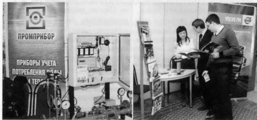
VIII Калужский промышленный форум «Промышленная политика 2020», 25 февраля 2011 г.

Калужская область приобрела блестящую репутацию, которой мы дорожим. Сделано было очень много. И за это я искренне благодарен всем, кто прямо или косвенно принял участие в этих процессах. Но репутация, как известно, вещь очень хрупкая. И наша общая задача — беречь ее.