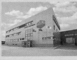
Всего за год появилось около 5 тыс. новых рабочих мест.

2010 год вошел в историю как год большого старта. Мы открыли 14 новых промышленных предприятий. Это рекордное достижение! Ими стали завод по производству автомобилей под марками «Пежо», «Ситроен» и «Митсубиши». Предприятие крупнейшего в мире производителя автокомпонентов — «МагнаТехнопласт Калуга». Штамповочное производство «Гестамп-Северсталь» и металлоцентр «Северсталь-Гонварри». Центр энергетических технологий американской корпорации GeneralElectric. Кроме того, свои производства запустили компании L'Oreal, «Лоте Конфекшенери», «KT&G», «Терекс», «МАКО Фурнитура», «Форбо Калуга», «ВМК Инвест». Заложено фундамент в формирование крупного агротехцентра на территории будущего индустриального парка «Детчино». Здесь обосновались компании «Grimme» и «Lemken».