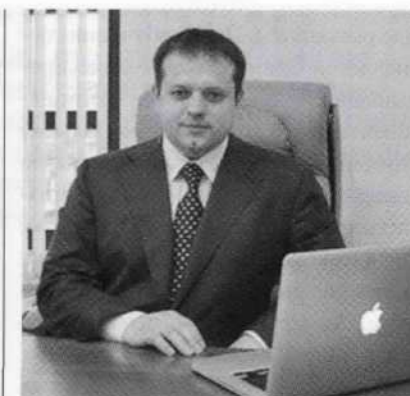
Р.А.Заливацкий, министр экономического развития Калужской области

И вот здесь я сделаю акцент еще на одном вопросе, который мне много раз задавали: почему налоговые