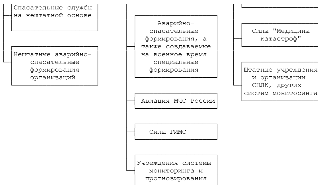
Рис. 1 - Состав сил, привлекаемых для решения задач гражданской обороны

Для решения задач в области гражданской обороны воинские части и подразделения Вооруженных Сил Российской Федерации, других войск и воинских формирований привлекаются в порядке, определенном Президентом Российской Федерации.