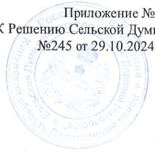
СХЕМА избирательных округов для проведения выборов депутатов Сельской Думы сельского поселения «Деревня Никольское»