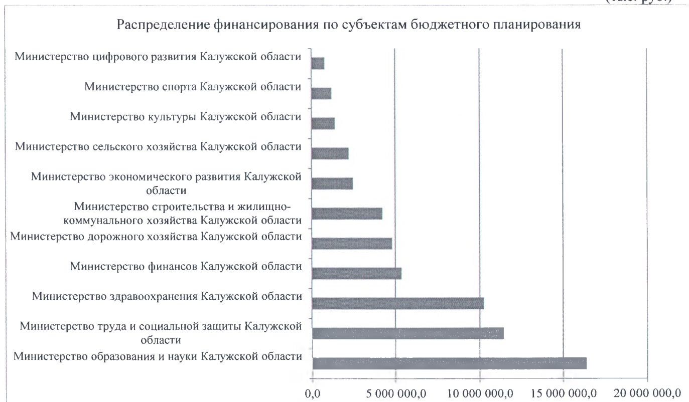
Диаграмма 3 (тыс. руб.)

5.4. Структура расходов областного бюджета на 2021-2023 годы по разделам классификации расходов бюджетов представлена в таблицах 6 и 7.