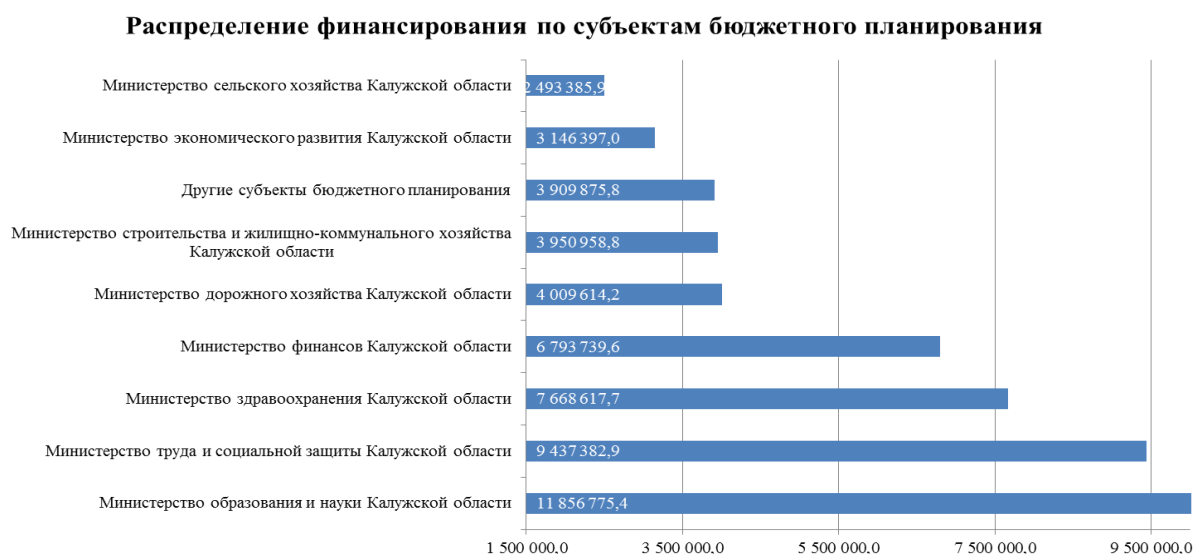
Диаграмма 4 (тыс. руб.)