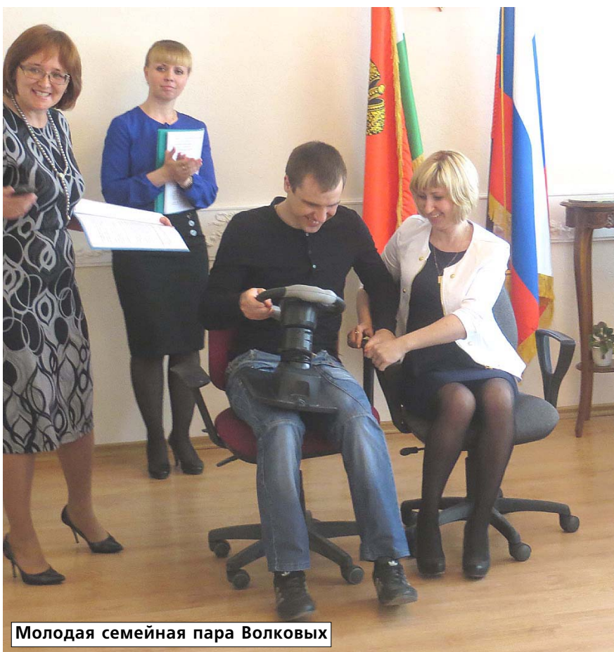
Молодая семейная пара Волковых

Например, один из мифов гласит, что в браке супруги должны иметь каждый свою личную жизнь, отдельный досуг. Участники не согласились с таким мнением. Ложные представления о личной свободе льстят человеку, но в семье должны учитываться интересы и потребности обеих супругов и для более успешной, счастливой семейной жизни находить свое воплощение. А вот супруги, имеющие детей, счастливее, чем бездетные, совсем не миф, а реальность. И это подтвердили семейные пары. Но не согласились с тем, что нельзя быть искренним с