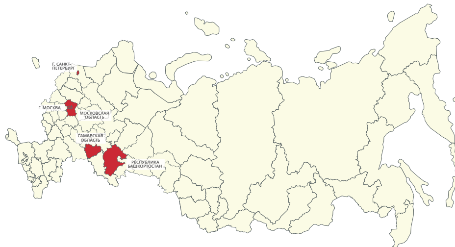
Динамика показателей передачи СО НКО услуг населению в сфере социальной защиты и социального обслуживания