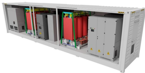
Преобразователи 1,5 ~ 6,35 МВт солнечных электростанций в контейнере