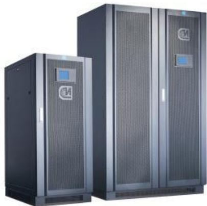
Модульные ИБП СИП380А МД