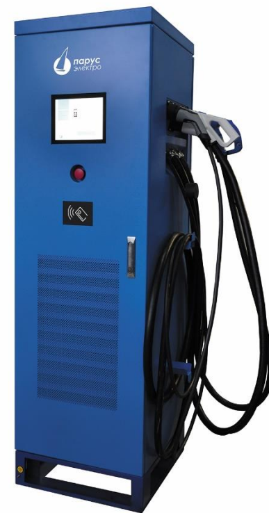
Быстрая зарядная станция 72кВт