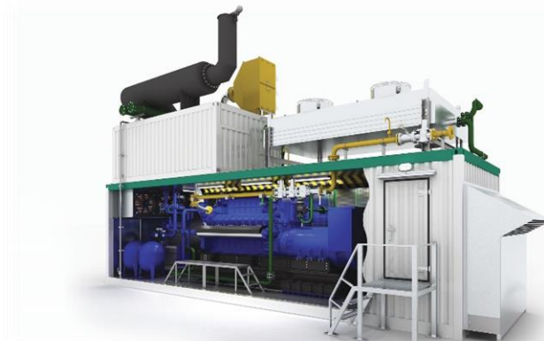
Газопоршневые установки 1 ~ 50 МВт