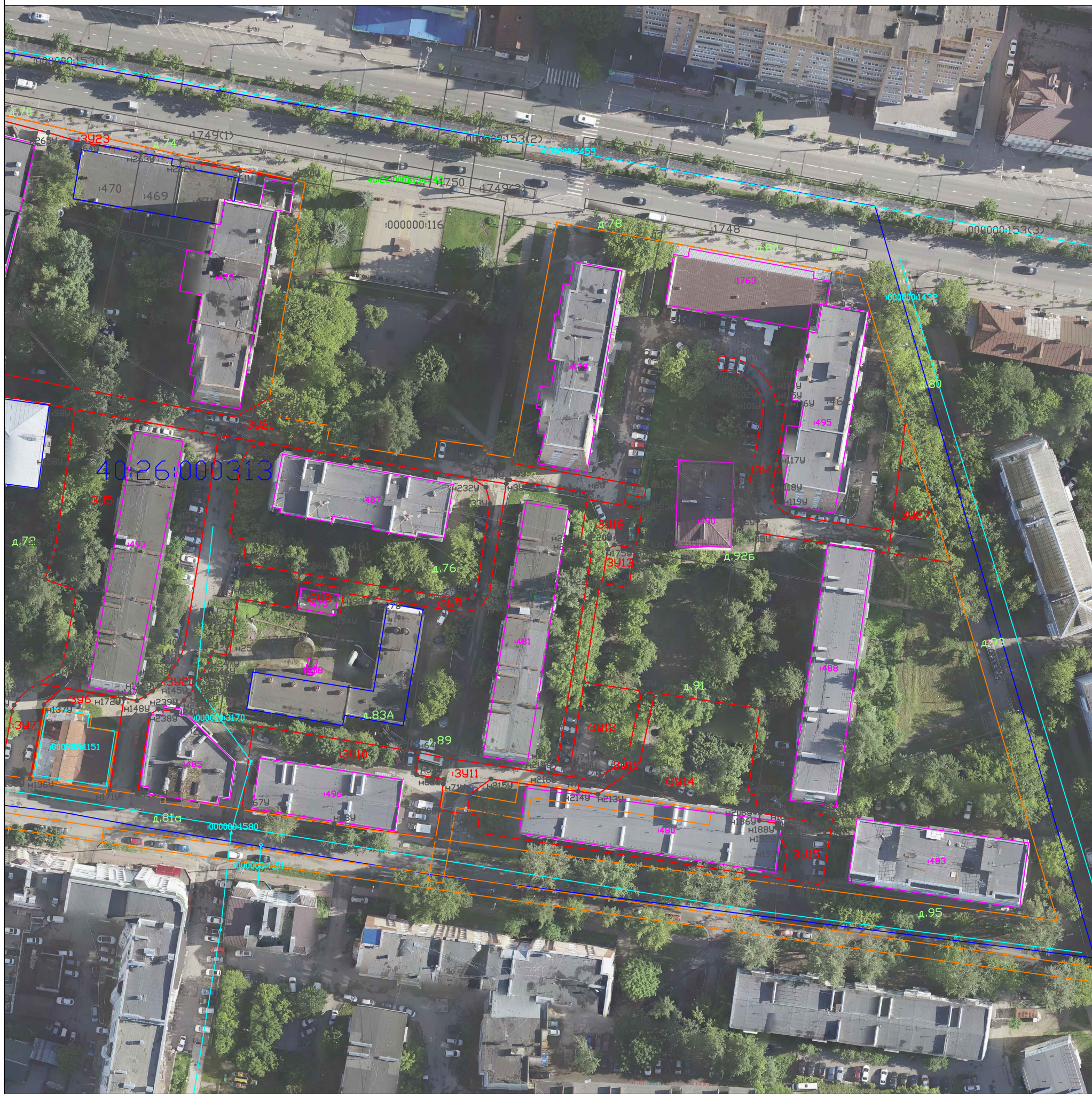
Схема границ земельных участков